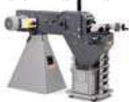
Λειαντήρας ακτινικής λείανσης