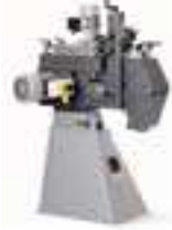
Λειαντήρας διαμήκους λείανσης